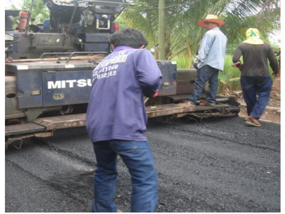
ภาพถ่าย: ขณะดำเนินการ