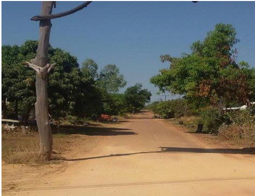
ภาพถ่าย: ก่อนดำเนินการ

1.7 โครงการปรับปรุงซ่อมแซมถนน คสล. ภายในเขตเทศบาล (ปูทับแอสฟัลท์ติกถนนจากประตูทางเข้าหมู่บ้านถึงศาลาประชาคม) บ้านทรายทอง