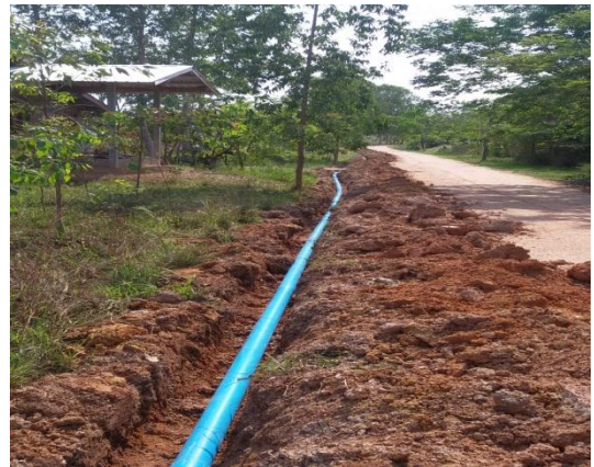
ภาพถ่าย: ดำเนินการแล้วเสร็จ