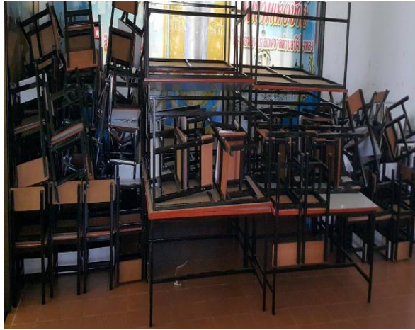
2.18 โต๊ะเก้าอี้นักเรียนอนุบาล 6 ที่นั่ง