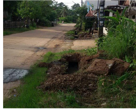
ภาพถ่าย: ขณะดำเนินการ