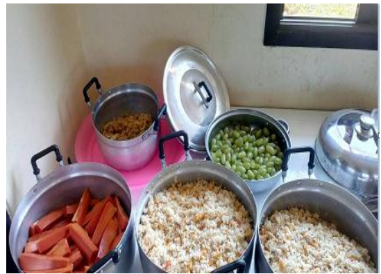
2.7 โครงการสนับสนุนค่าใช้จ่ายการบริการสถานศึกษา ค่าอาหารกลางวันให้กับนักเรียนศูนย์พัฒนาเด็กเล็กในสังกัดเทศบาล