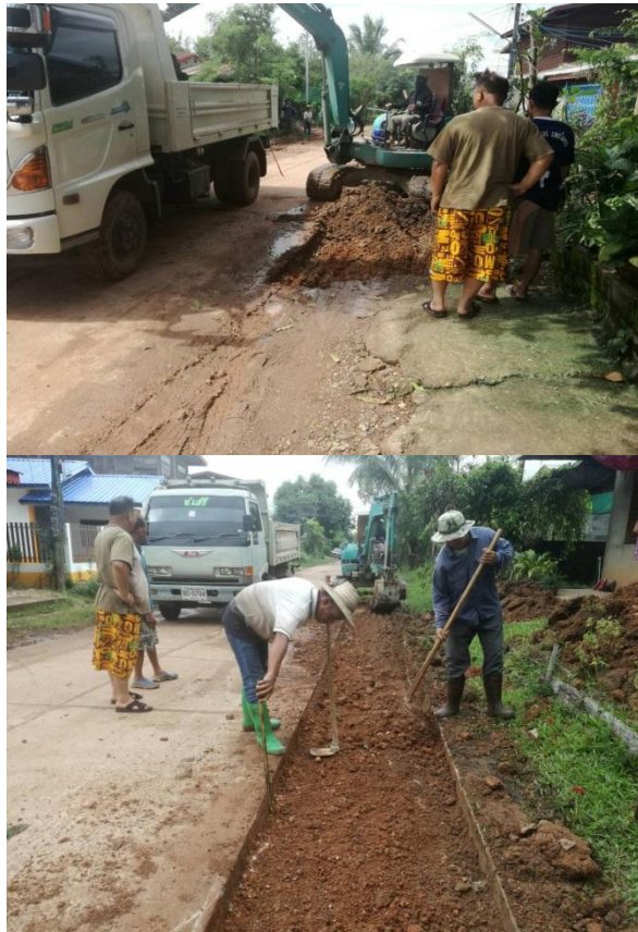
ภาพถ่าย: ดำเนินการแล้วเสร็จ