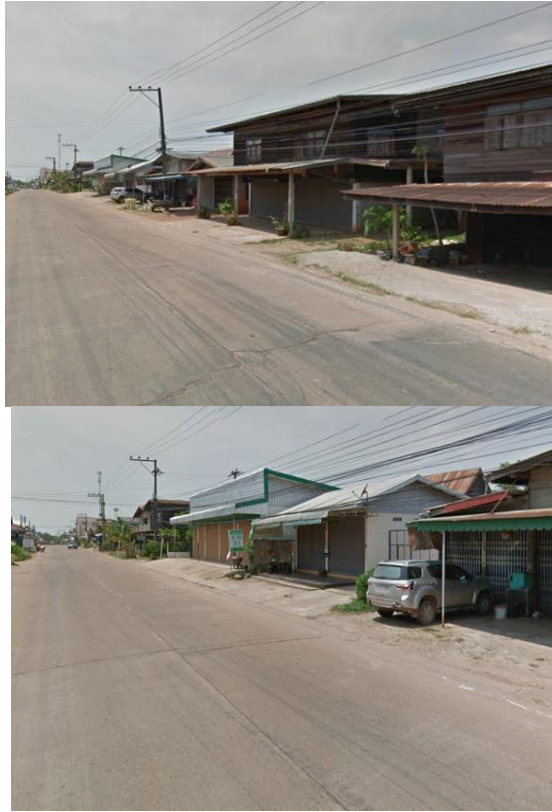
ภาพถ่าย: ขณะดำเนินการ