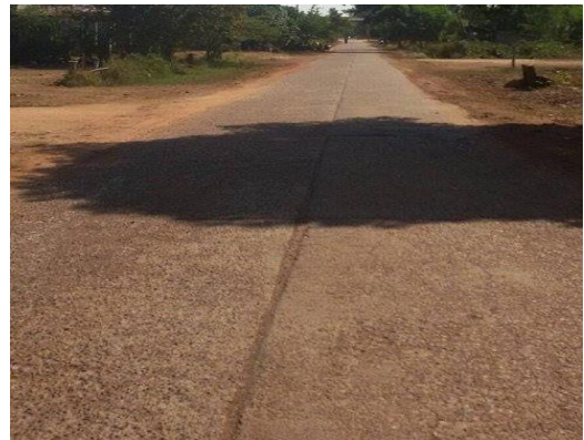
ภาพถ่าย: ขณะดำเนินการ