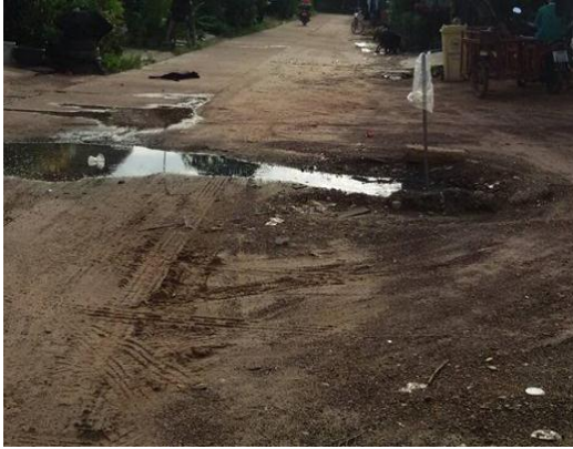
ภาพถ่าย: ก่อนดำเนินการ