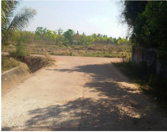
ภาพถ่าย: ก่อนดำเนินการ