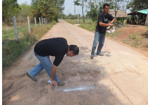
ภาพถ่าย: ขณะดำเนินการ