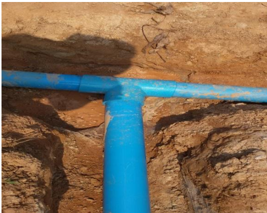
ภาพถ่าย: ขณะดำเนินการ