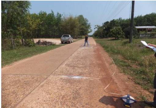
ภาพถ่าย: ก่อนดำเนินการ

1.11 โครงการค่าใช้จ่ายในการซ่อมแซมอาคารสิ่งของประเภทที่ดินและสิ่งก่อสร้างการบำรุงรักษาทรัพย์สินอื่นๆ ของเทศบาลซ่อมแซมถนน คสล.ภายในเขตเทศบาลตำบลบึงโขงหลง