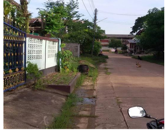
ภาพถ่าย: ขณะดำเนินการ