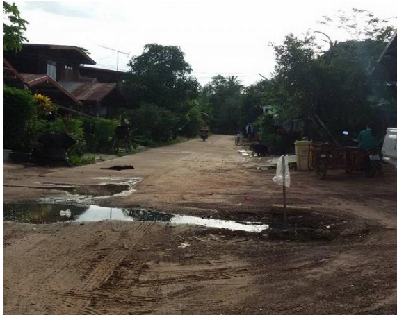
ภาพถ่าย: ก่อนดำเนินการ

1.2 โครงการก่อสร้างขยายไหล่ถนน คสล. ภายในเขตเทศบาล (บริเวณบ้านโนนหนามแท่ง) พื้นที่ไม่น้อยกว่า 400 ตรม. หนา 0.15 ม. บ้านโนนหนามแท่ง