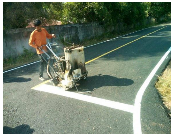
ภาพถ่าย: ดำเนินการแล้วเสร็จ