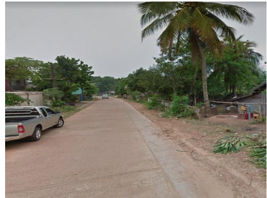
ภาพถ่าย: ขณะดำเนินการ