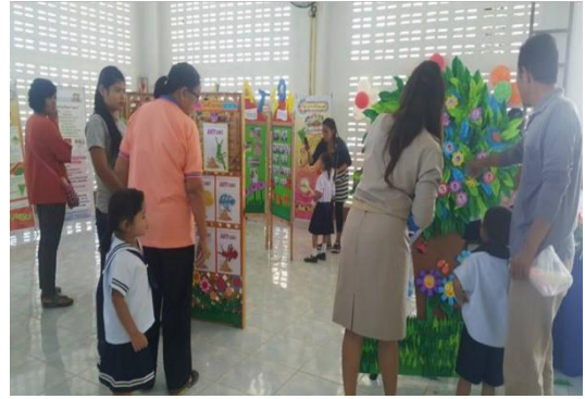
2.6 ค่าใช้จ่ายสนับสนุนอาหารกลางวันเด็กนักเรียนโรงเรียนอนุบาลเทศบาล