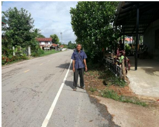
ภาพถ่าย: ขณะดำเนินการ